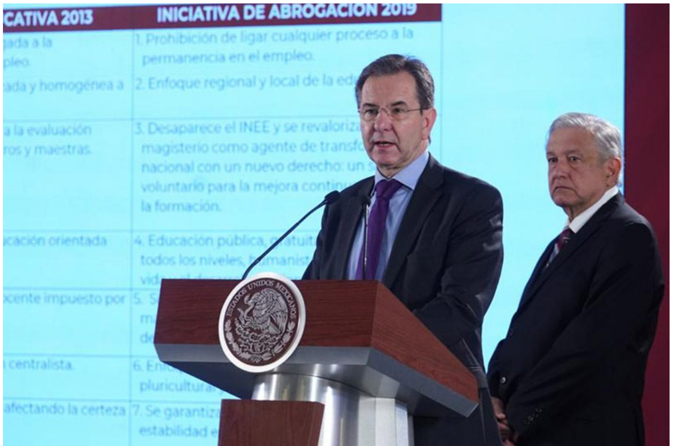
Imagen: Secretaria de Educación Pública (2019)

Fue publicado el Decreto que modifica la Constitución para establecer la nueva reforma educativa. Estas son algunas claves de lo que cambió.