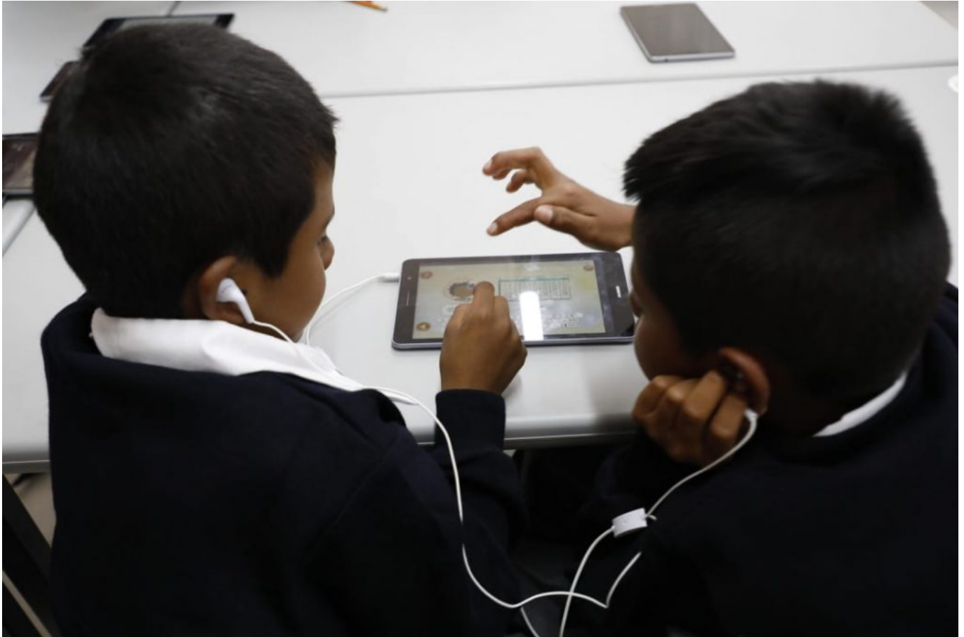
Imagen: Secretaría de Educación Pública (2019)