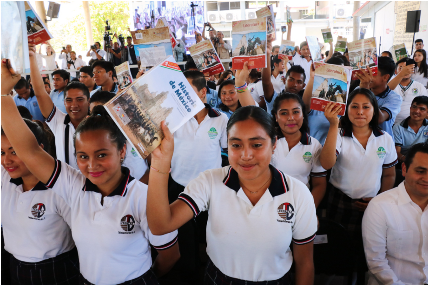
Imagen: Secretaría de Educación Pública (2017)

Algo interesante de la reforma educativa es que temas como la igualdad y los derechos humanos aparecen ahora señalados de manera más clara: “La educación se basará en el respeto irrestricto de la dignidad de las personas, con un enfoque de derechos humanos y de igualdad sustantiva”.